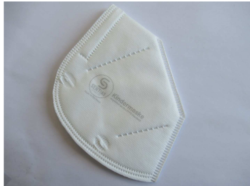
55271336002 Sentias Kindermaske - Fleece