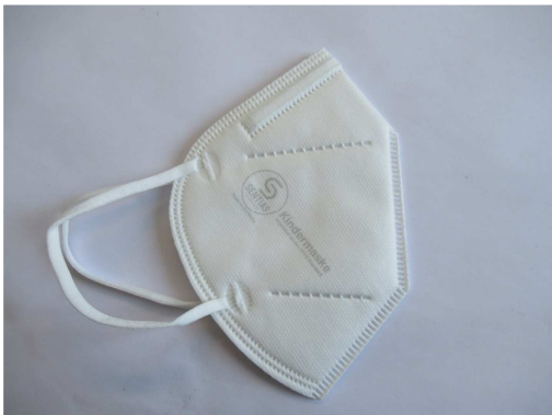
55271336005 Sentias Kindermaske