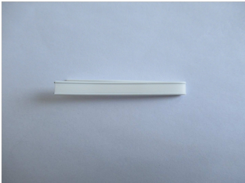
55271336001 Sentias Kindermaske - Metallbügel